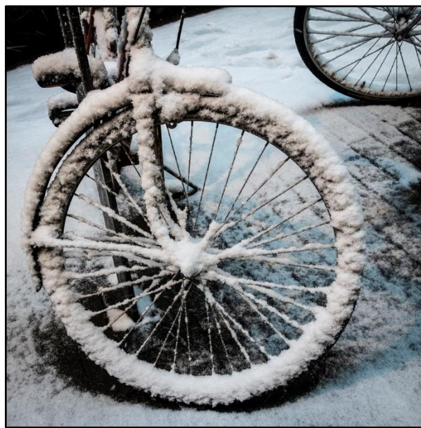
Vintern har rullat in..