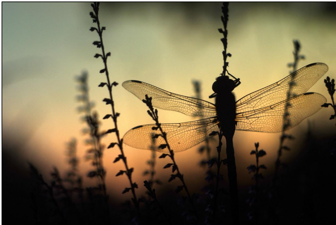
Månadens fotograf: Ylva Sjögren, enskild medlem i RSF