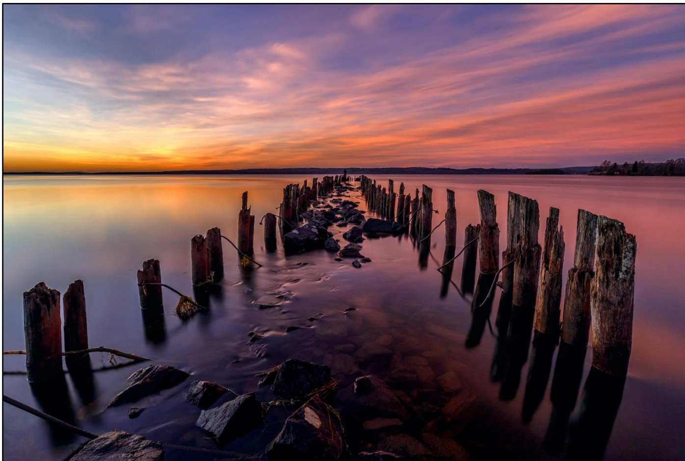
Månadens fotograf: Patrik Nilsson, Sundsvalls fotoklubb