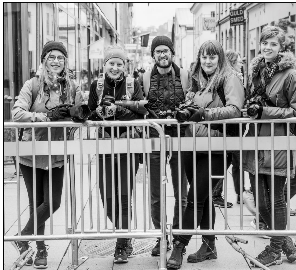
Delar av Ungdomssektionen i Vårgårda Fotoklubb

Kanske kan vår satsning på en Ungdomssektion vara av intresse för andra klubbar i landet. Angelägna satsningar handlar ofta om såväl glädje som vedermödor. Men låt oss inte ge upp - låt oss alla ta nya tag inför en förnyande framtid i landets fotoklubbar!