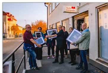
NFFF Project grant: Fotoklubben Fokusera Flen (2018)

Sommeren 2017 ønsket jeg å påbegynne et nytt fotoprojekt. Jeg ville gjøre et fotodokumentarisk prosjekt om menneskers ulike levesett, og hadde planer om å reise til Balkan og Marokko.