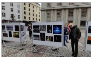
NFFF Project grant: Bekkalokket fotoklubb (2022)

Exempel på projekt hämtade från NFFF hemsida: