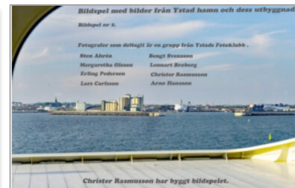
NFFF Project grant: Ystad Hamn (2019)

Fotoklubben Fokusera Flen's första utställning, "Nattligt Fokus på Flen".