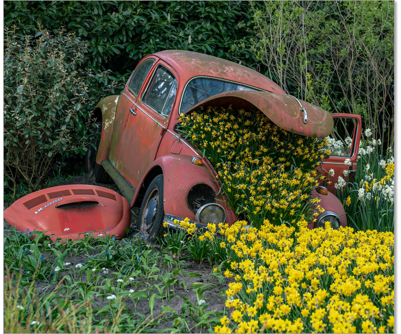
Projekt 52 /2024 -06

RSF, Riksförbundet Svensk Fotografi, är paraplyorganisation för 135 Fotoklubbar. Tillsammans i klubbarna och med våra Direktmedlemmar är vi ca. 6000 fotograferande medlemmar. Etablerades 1946. Sveriges Fotoklubbskarta