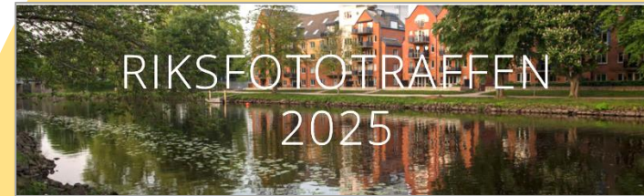
Skärm dump FK Kamera.