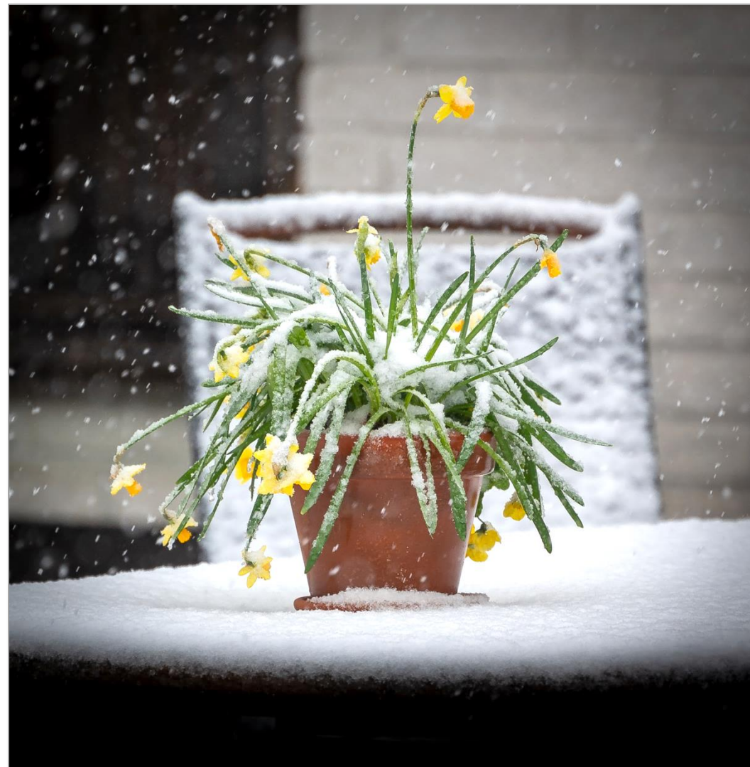
Projekt 52 /2024 – 01

Exponera! utkommer med ca. 10 nummer per år, nära månadsskiftet. Manusstopp är den 20:e varje månad. redaktion(at)svenskfotografi.org Redaktör: Peter Heljesten.